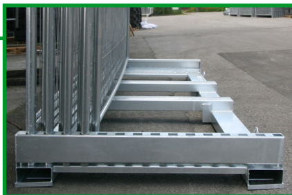
Spor til gaffeltruck både på kort- og langsider gir rask og enkel lasting/lossing.