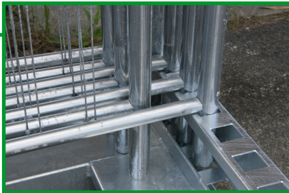
Gjerdene settes ned i firkantede rammer. Gjør det lett å plassere gjerdene i pallen, selv om det skulle være skade på rør-enderne.